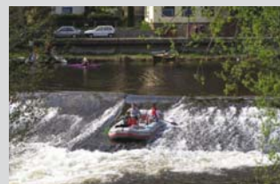
Raft v Malé Skále