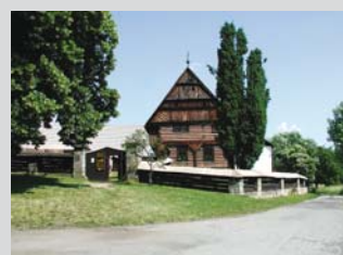
Dlaskův statek Dolánkách

Příjezd do Turnova, prohlídka města Turnov, treking – Zlatou stezkou Českého ráje přes skanzen v Dolánkách u Turnova do Roudného na ubytování (případná zavazadla dovezeme z Turnova přímo k nám). Navečer si zahrajeme volejbal, nohejbal, stolní tenis, případně další hry dle přání.