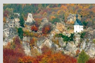
Malá Skála – Panteon

Prohlídka zříceniny hradu Frýdštejn (natáčely se zde pohádky O ševci Matoušovi a Záhadný hrad v Karpatech), z hradu potom pěšky turistickou stezkou na Malou Skálu. Zde výstup na sklaní hrad Panteon, jeho prohlídka a následně návštěva největšího lanového centra Žlutá Plovárna v Malé Skále. Z Malé Skály potom na raftu do Doláněk. Možnost koupání v řece Jizeře. Večer ohýnek, opékání vuřtů, možnost her.